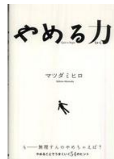
「やめる力」 マツダ ミヒロ