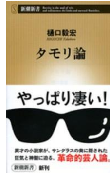
「タモリ論」 樋口 毅宏