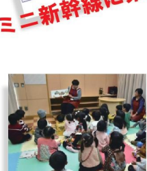
おはなし会 スペシャル