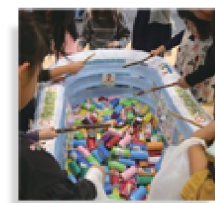
エコランドがやってくる