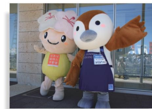
みなみちゃん、ミヤリーに 会いに行こう!